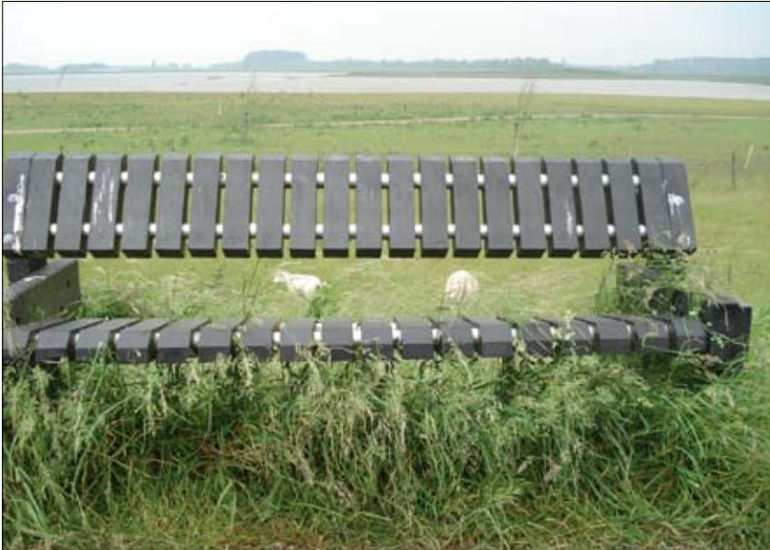
2 e prijs