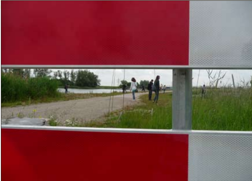
2 e prijs