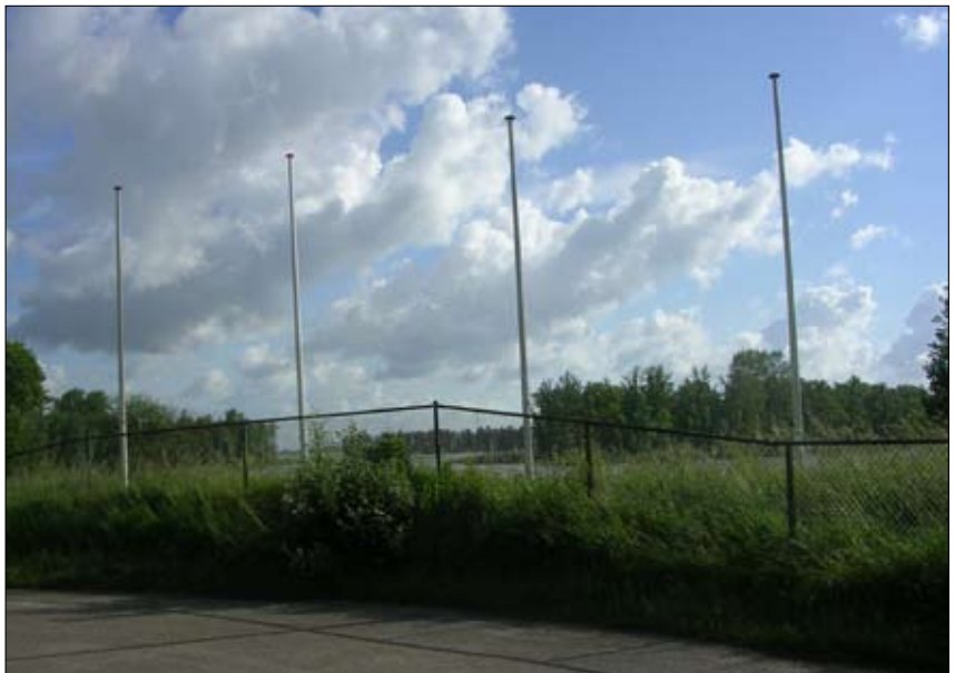
3 e prijs