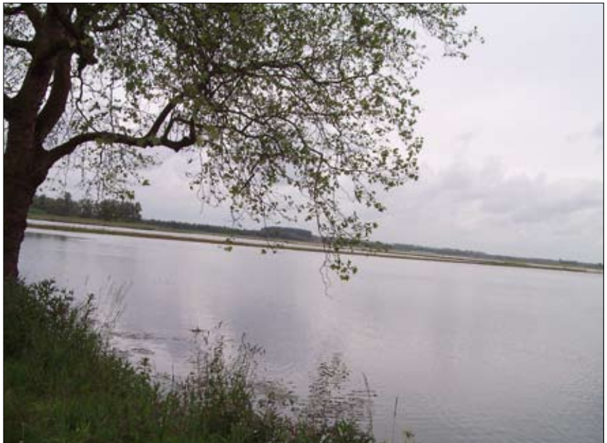
3 e prijs