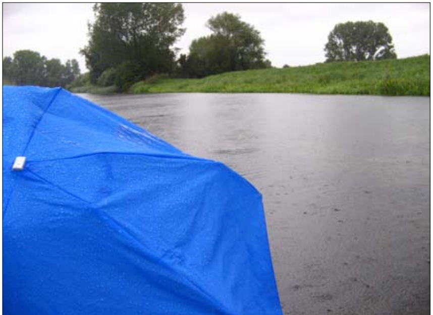
3 e prijs