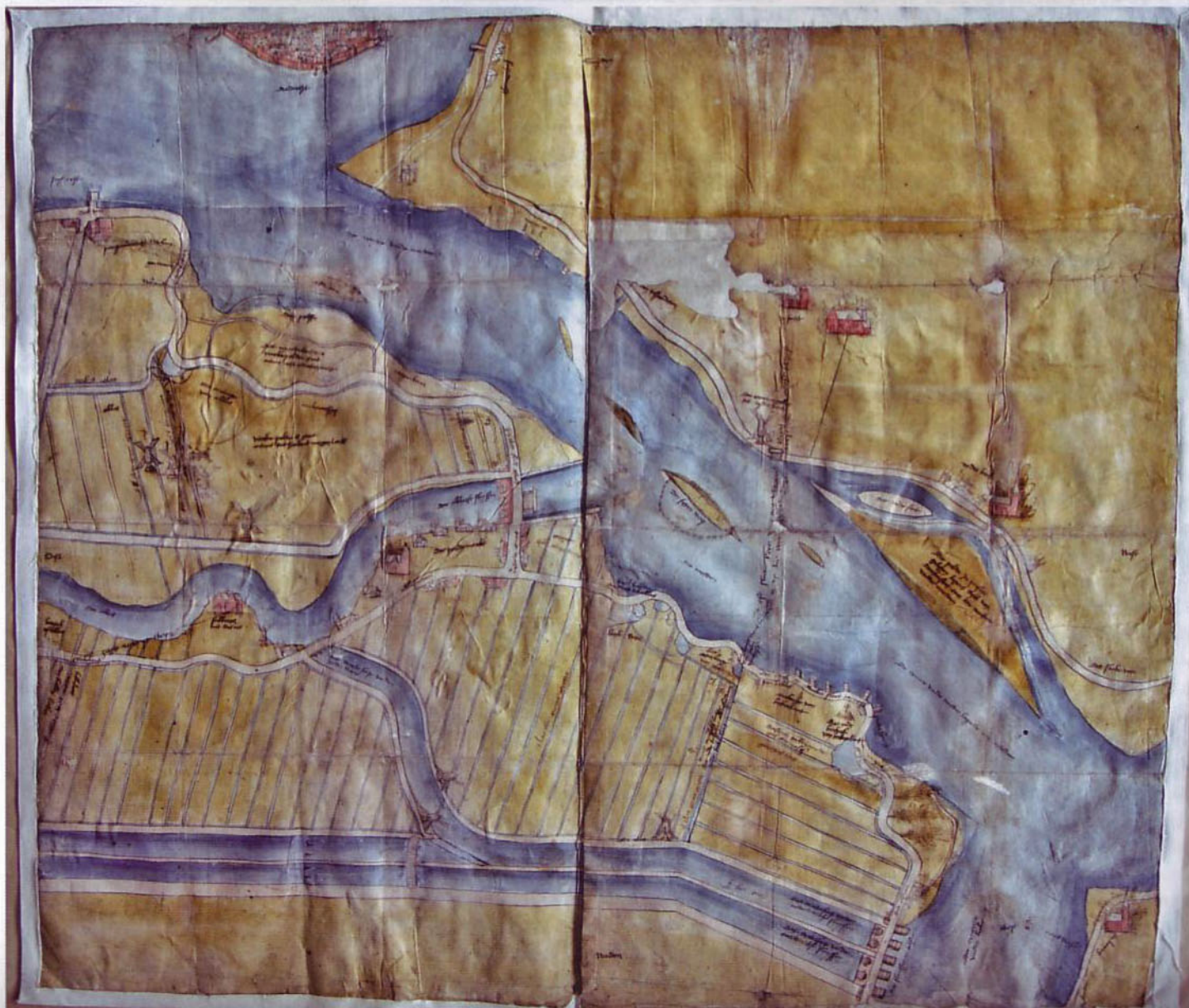
1. De Gorkumse kaart, gemaakt in opdracht van de dijkeemraden van de Alblasserwaard (Regionaal Archief Gorinchem, Hoogheemraadschap Alblasserwaard en Arkel beneden de Zouwe, inv.nr. 92).