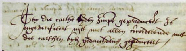
3. Passage over de Leidse kaart in een processtuk uit 1545 (Gemeentearchief Rotterdam, toegang 336, 15II, omslag A-S.)

Ter verduidelijking bij het proces van 1545-1549 en om de complexe situatie ter plaatse inzichtelijk te maken voor de rechtbank zijn er minstens twee manus-