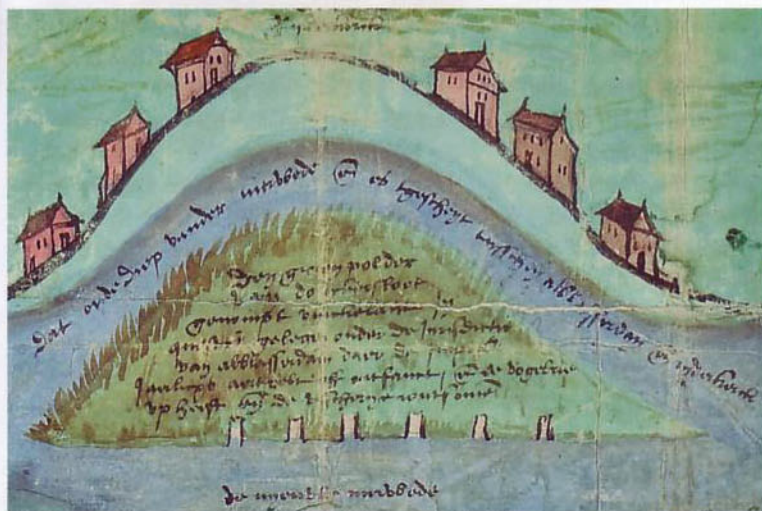
8. 'De polder in kwestie' Donkersloot op de Leidse kaart.

huidige Rijzenwiel. Eronder staat een tekst die een aanwijzing geeft over de opdrachtgevers van de kaart: