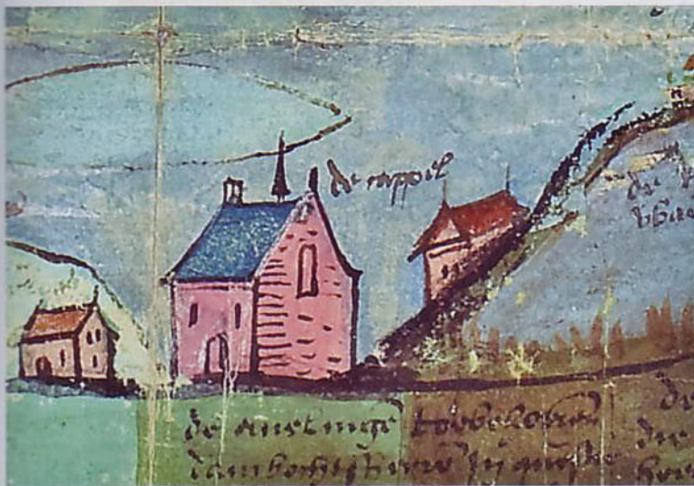
6. Kapel naast het Rijzenwiel op de Leidse kaart.