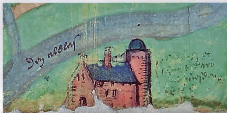
5. Fantasievoorstelling van Hof Souburg met ronde toren op de Leidse kaart.

Onder de molen vinden we Hof Souburg (afbeelding 5). Ook dit is een fantasievoorstelling. Wanneer het kasteel verloren is gegaan is niet zeker maar opgravingen spreken over een vierkante toren en niet een ronde zoals op de kaart is aangegeven. Helaas is een deel van de tekst moeilijk leesbaar maar waarschijnlijk staat er bij de afbeelding van Hof Souburg geschreven: 'Soburgh es thys daer [Outhu]esden [woent]'. Het geslacht Outhausden neemt in 1533 de